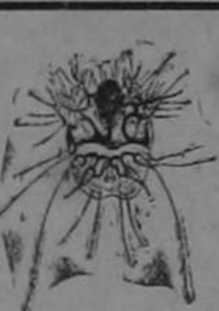
MACHO AUMENTO: 500 VECES

COMBATA ESA PICAZON O RASQUINA CON EL FAMOSO ACEITE VERDE